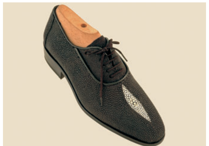
Modell 1306 LUCCIO

Das lanzettförmige, elfenbeinfarbene Perlmuster ist typisch für den Stachelrochen und sorgt für einen hohen modischen „Wiedererkennungswert“. Diese „Mittelperle“ fällt bei jeder Haut etwas anders aus und so ist jedes Stück einzigartig wie ein Fingerabdruck!