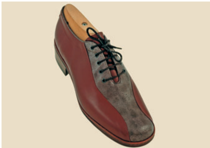
Modell 1307 A RAZZA

Anders als Dorsch- oder Lachsleder, die aufgrund ihrer Reiß-Empfindlichkeit oft nur als Besatzstücke zum Einsatz kommen können, weist CREPA Seewolf trotz seiner dünnen Haut eine unglaubliche Reißfestigkeit und Robustheit auf. Durch die fehlende Schuppenstruktur ist CREPA Seewolf leicht zu reinigen und pflegeleicht.