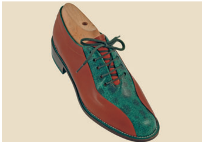
Modell 1307 B RAZZA

Obermaterial: CREPA Seewolf Farbe: grau SEGETIA Farbe: 612